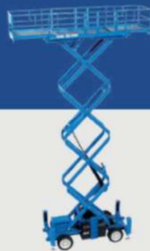
GS - 4390RT