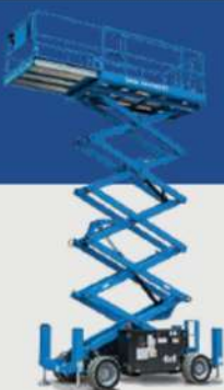
GS - 4069