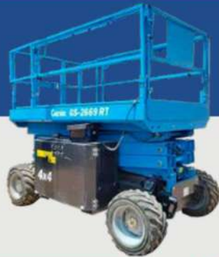
GS - 2669RT