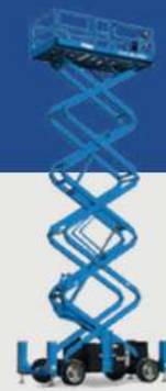
GS - 5390