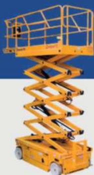
GCOSM - P 4A0C6T 912