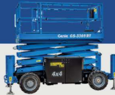
GS - 3369RT