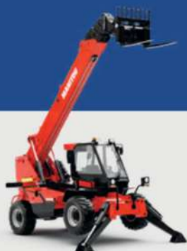
MXT 1740 P